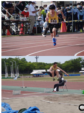
西目中代表として頑張った部員・補助員

5月26日（木）、爽やかな薫風そよぐ晴天の下で、「第76回本荘由利中学校陸上競技大会」が開催されました。25日に行われた壮行会の中で、鷹****陸上部キャプテンのあいさつのおとり、一人一人が個々の力を出し切って頑張ってくれました。短い練習期間ではありましたが、3年生、2年生、1年生の選手の皆さん一人一人の活躍により、女子総合第5位、男女総合第6位の賞状を持ちかえてくれました。記録に挑んだ選手の皆さん、運営や補助に努めてくれた皆さんありがとう！