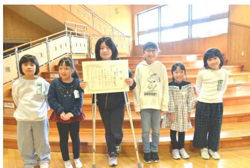
「U10キッズバレーボール交流会」 成績 敢闘賞 西目バレーボールスポーツ少年団