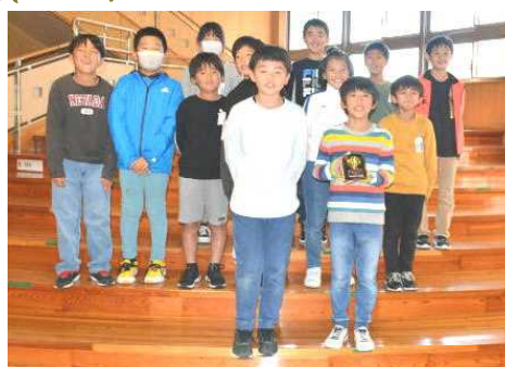
「36回TOYOTAジュニアカップ」 成績 第2位 西目サッカースポーツ少年団 (U-11 本荘由利地区代表)

子どもたちがやがて、県内外で秋田の発展を支える「人」となることを願い、「あきた教育の日」を設ける。 秋田県教育委員会