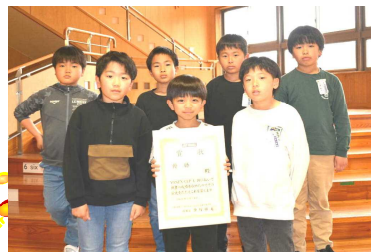
「由利本荘市スポ少競技別交流会」 成績 第一位（U10の部） サッカースポーツ少年団西目Aチーム