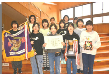
「初瀬カップ本荘由利地区春季バレーボール大会」 成績 優勝 西目バレースポーツ少年団