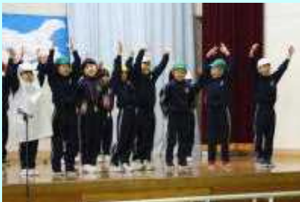
1年 こよししょうがっこうのくじらぐも