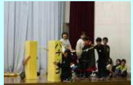
3年 What's subject do you like?