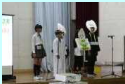
5年 KYS おいしいお米の秘密をさぐろう！