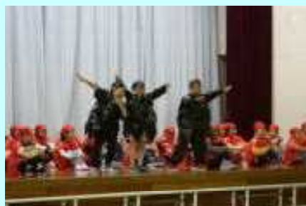
2年 シン・スイミー