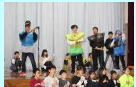
6年 子吉小学校のリーダーズ