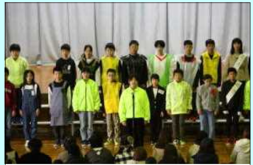
全校合唱「ふるさと」