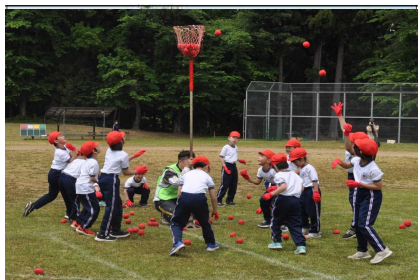
【1・2年生 ダンス&玉入れ】