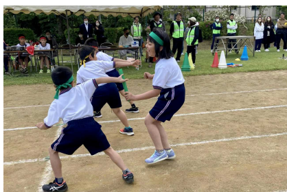
【2年生 色別全員リレー】