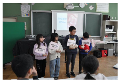
4年 健康づくり教室