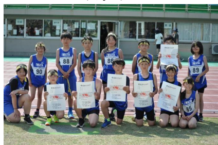
小学校陸上競技大会