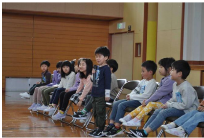
1年生こんにちは集会