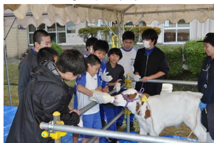
わくわくモーモースクール