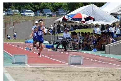
男子コンバインドB 伊***