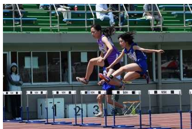
女子コンバインドA 高***