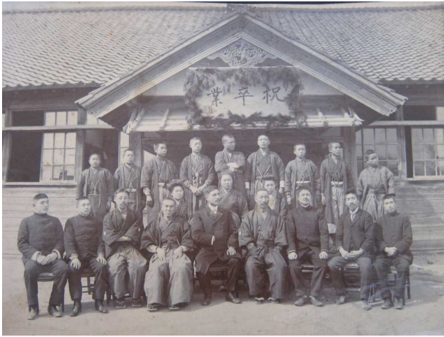
明治44年（111年前）の卒業式（日渡校舎）