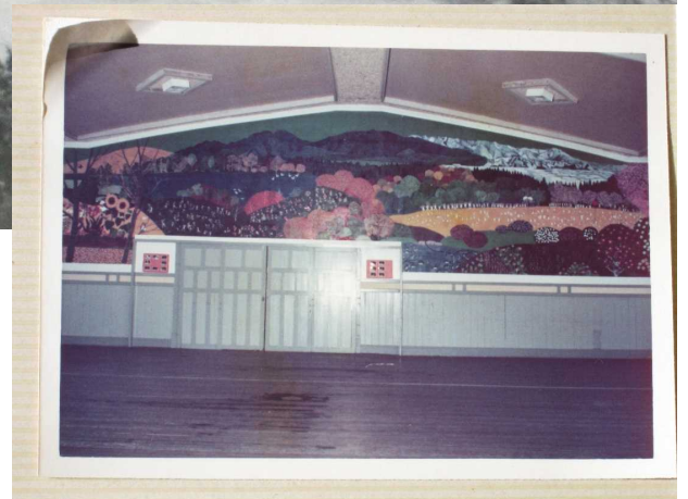
右：昭和49年（48年前）創立100周年記念で 作成した壁画（講堂）