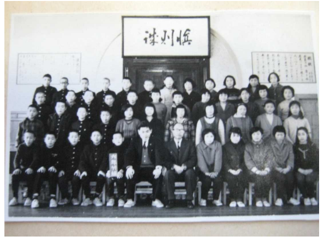
昭和37年（60年前）の卒業式（講堂にて）