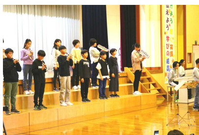
【6年生 レインボーコンサート】