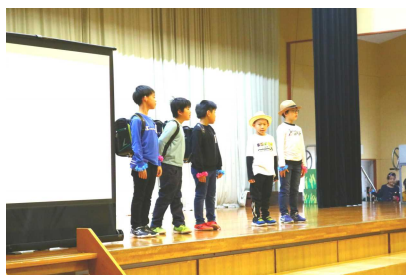
【3年生 わたしたちの岩谷じまん】