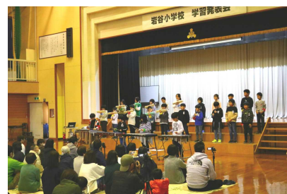
【4年生 スマイル 秋田!】