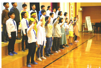
【5年生 プロジェクトK】