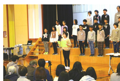
【6年生 おわりのことば】