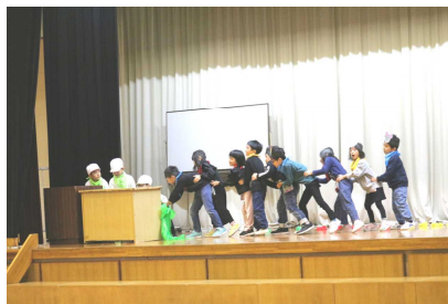
【1年生 大きなかぶ&ツバメ】