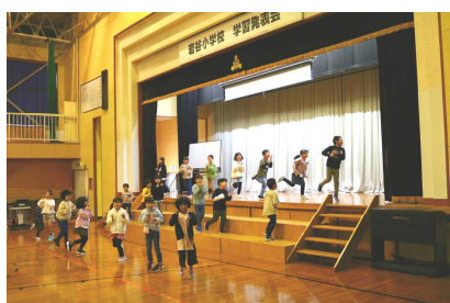
【2年生 どうぶつたちのひみつ】

発表以外にも、各委員会による進行や道具の出し入れ、会場の飾り付けなどの仕事は高学年が頑張ってくれました。「いわやっ子ギャラリー」では、図工の時間やクラブ活動での作品展示もご覧いただきました。たくさんの保護者の皆様や地域の皆様(なんと総来場者は350名!)から温かい応援の拍手を頂戴し、子どもたちも満足そうな表情で、またひとつ大きく成長することができたと思います。本当にありがとうございました。