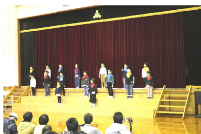
【1年生 はじめのあいさつ】