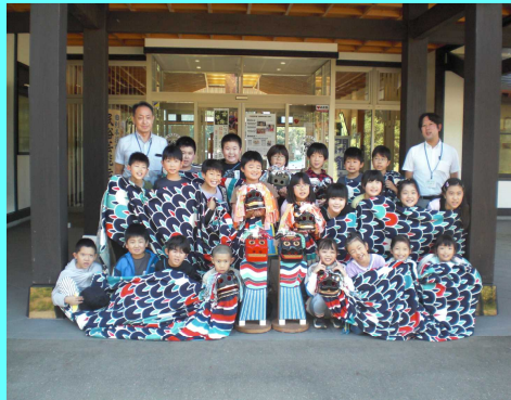
「まいーれ」の前で記念

由利本荘市には、今回のような見学スポットがたく さんあります。由利本荘市の「よさ」を見つけ、他の 地域の人に紹介するためにも、地元のことをよく知っ ておくというのは大事なことだと思います。