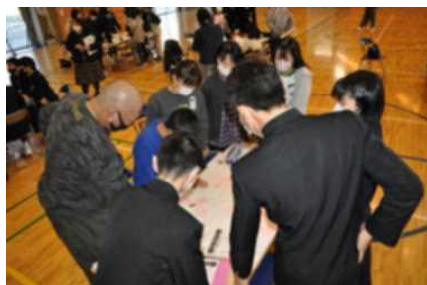
▲各グループで出された意見を分類・整理してまとめています