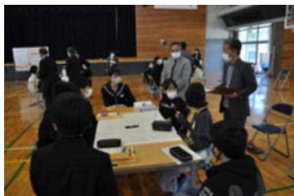
▲6年生もグループに