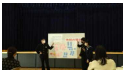
◀ 代表して3つのグループから発表がありました