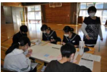
▲自分の考えを書き出します