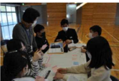
▲意見を出し合います