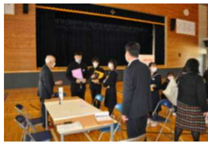
▲顔合わせをしています