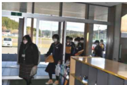
▲久しぶりの小学校へ到着

意見交換は1時間弱の短い時間ではありましたが、地域の魅力やこれからの未来について大いに語り合うことができました。