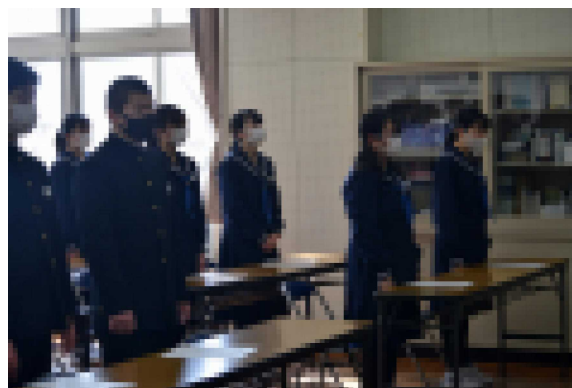
【気持ちも新たに校歌を斉唱する新入会員】