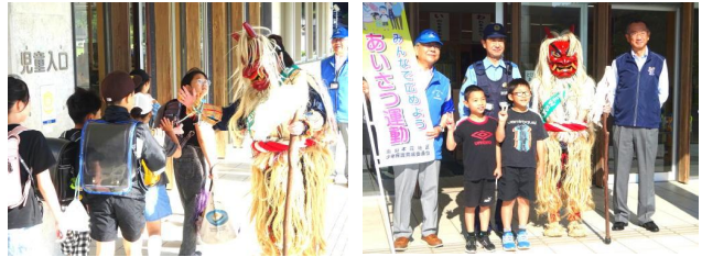
【なまはげとタッチ】

秋田県警察では、平成15年より「なまはげNEWS隊」を組織し、様々なことに取り組んでいるそうです。この日は、いわきっ子たちのために“朝のあいさつ運動”に来てくれました。子どもたちには予告していませんでしたので、玄関前に立っているなまはげにびっくりです。本格的な出で立ちでしたので、テンションが上がる子や恐る恐る近づいていく子など、反応は様々でした。由利本荘警察署、少年保護育成委員（警察ボランティア）の皆様、ありがとうございました。