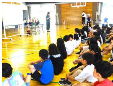
【防犯についての講話】

また、この日は秋田県警察音楽隊をお招きし、講話の後に演奏会を催しました。子どもたちがよく知っている曲を選曲してくださって行って、とても楽しいひとときを過ごしました。演奏に合わせて口ずさんだり踊り始めたりする子もいました。