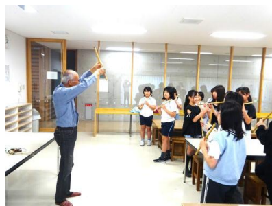
【笛の練習のようす】