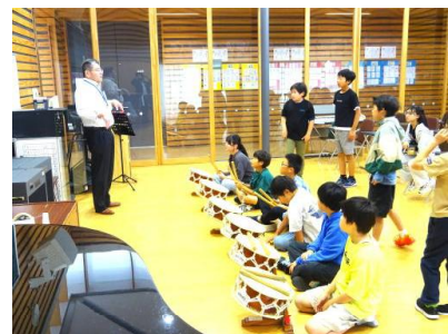
【太鼓の練習のようす】