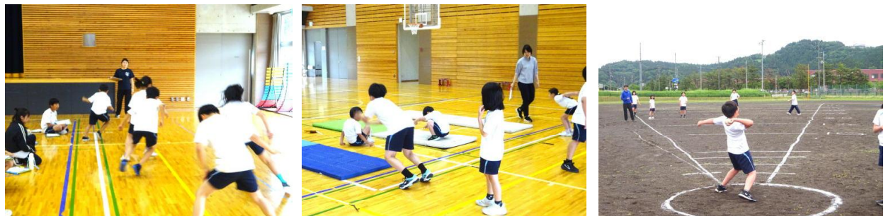
【各種目のようすから】

岩城小学校ではこの調査を、縦割り活動のグループを活用して実施しています。上学年の児童が下学年の児童を見届けたり励ましたりしながら、ローテーションで各種目に挑戦していました。