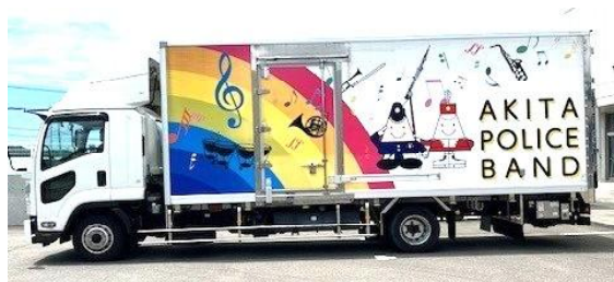
【警察音楽隊の移動専用車】