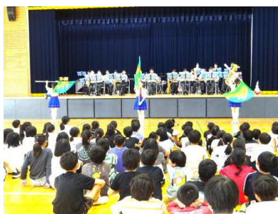
【演奏のようす】（岩城地区出身の方もいました）