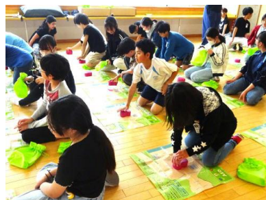
【胸骨圧迫の力加減を確認】

学校便り[いわきの子]は、岩城小学校ホームページにも掲載します。 ホームページでは、学校内外での子どもたちの活動などを、写真を添えて紹介しています