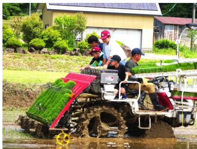
【田植え機への乗車体験】