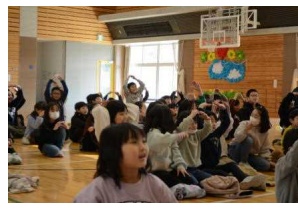
6年生のクイズに反応！