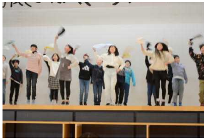
5年生 パワーあふれる ダンスとエール