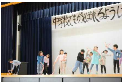
1年生 リボンを使ったダンス 歌「またあえる日まで」