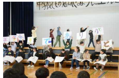
3年生 ダンス「ダンスホール」 エール