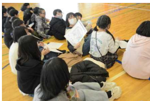
似顔絵を手にしてうれしそう

発表の最後は6年生です。〇×クイズで正解したら思い出を再現してくれるという6年生らしい笑いのある内容で、コミカルなダンスも見られました。チームワークのよさは抜群でした！