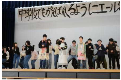
6年生 「マッショ売りの少女」 〇×クイズで思い出再現