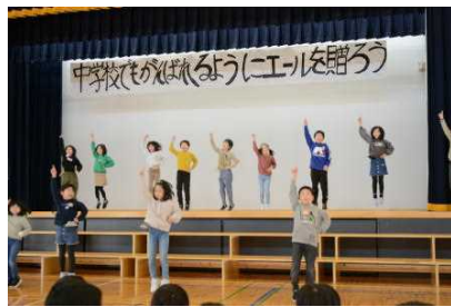
2年生 キレッキレのダンス 「最高到達点」