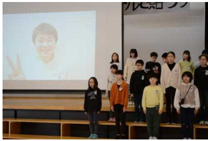
4年生 がんばりや得意なこと 「6年生の紹介」