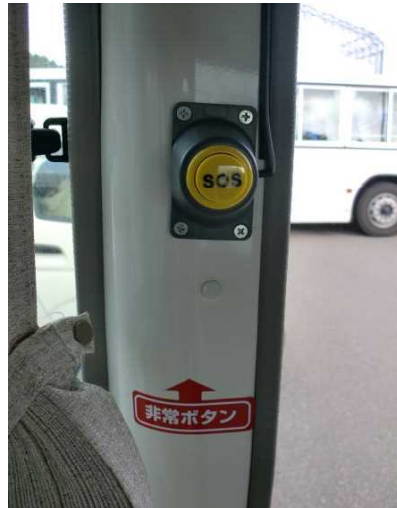
万が一のための非常用ボタン