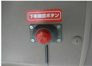
下車確認ボタン(運転士用)

10月25日、31日と秋田魁新報に記事が掲載されましたが、スクールバスに小中学生が置き去りにされる事故を防ぐために、由利本荘市ではバスに安全装置を設置してくれました。安全装置は運転士がエンジンを切ると作動し、「車内点検をして警報を切ってください」という音声がかかります。車内の点検後後部にある確認ボタンを押すと音が止まります。車内に取り残された児童生徒がいた場合、出入り口付近にある非常用ボタンを押すと「車にいます。助けてください」と車外に大音量が流れる仕組みになっています。