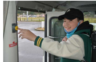
非常用ボタンを押すと・・・