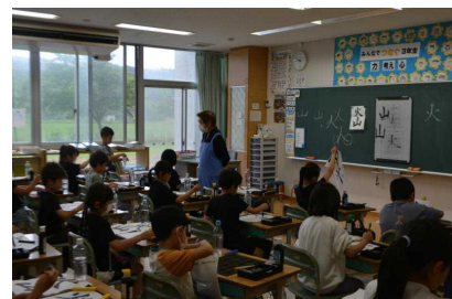
6 / 16 3年生