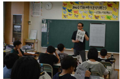
6 / 16 6年生