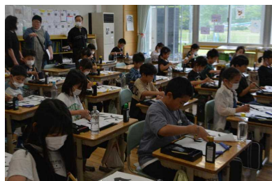
6 / 9 3年生

来週、再来週と各学年3回ずつ指導していただきます。先生方よろしくお願ひいたします。