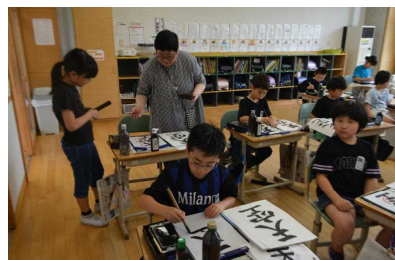
6 / 14 4年生