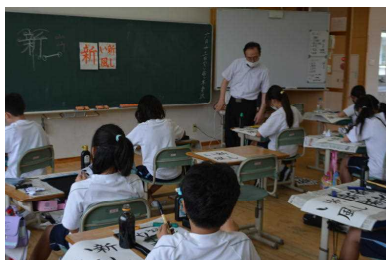
6 / 13 5年生