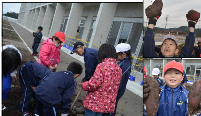
【いもほり 11月17日】 年間を通して畑の先生としてご協力いただきました。おかげで大収穫でした。