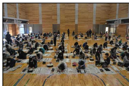
【校内書き初め大会 1月14日】 3年生以上は毛筆で、1、2年生は硬筆で書き初めを行いました。