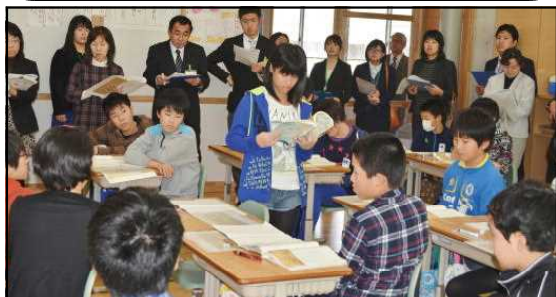
【市授業実践研究会 11月21日】 来校したたくさんの方々に子どもたちのがんばりを見ていただきました。