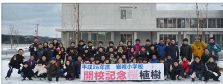
【開校記念植樹 12月10日】 6年生が7本の桜をグラウンドと校舎の間に植樹しました。今から花が咲くのが待ち遠しいです。