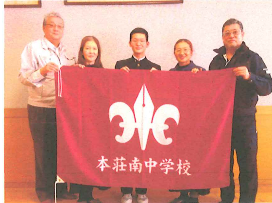
18期同窓生の方々の記念撮影