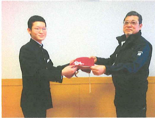
小西生徒会長と代表の方との贈呈式