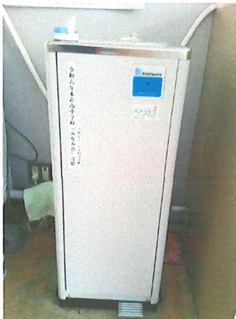
冷水器(1階ランルーム)