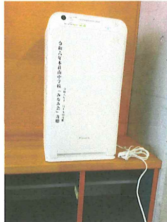
空気清浄機(生徒玄関前)