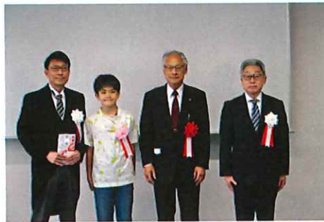
【贈呈式代表挨拶 6年越***くん】