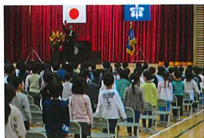
【式典での元気いっぱいの歌声】