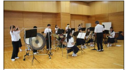
楽しい演奏 壮行演奏会

コンクールへの出場でしたので、今年こそは金賞をと臨んだ大きな挑戦でした。26日(金)に壮行演奏会やファミリーコンサートを開き、全校生徒や家族の前で演奏曲を披露しました。全校生徒や家族からの大きな拍手も、力になったのではないのでしょうか。本番のステージは、緊張の中でも、自分たちの演奏を精一杯表現できたことが受賞につながったと思います。おめでとうございます。