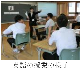
英語の授業の様子