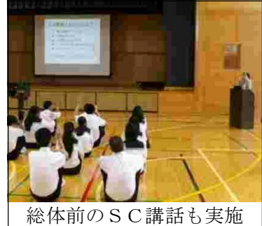
総体前のSC講話も実施