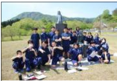
1年生 八塩いこいの森にて

早速、1、2年生は学びのフィールドを学校の外に移して、体験学習を行いました（3年生は修学旅行がこれに当たります）。生徒一人一人が、どんな課題を設定し、どのように探究的な学習を進めていくか、また、12月9日（木）には総合的な学習の時間発表会（PTA参観日）を予定していますので、どのような発表が行われるかが楽しみです。