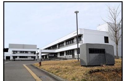
東由利中学校の校舎