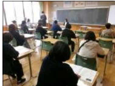
3 年学年懇談の様子