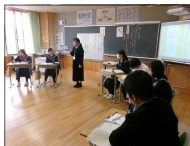
3 A 道徳の授業風景