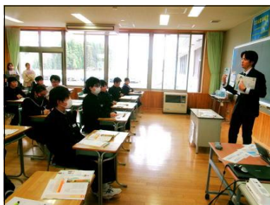
1 A 道徳の授業風景