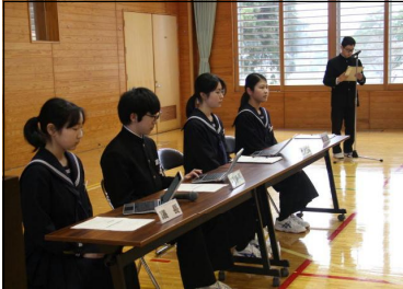
会を進める総務部と議長団