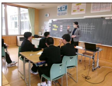
2 A 英語の授業風景