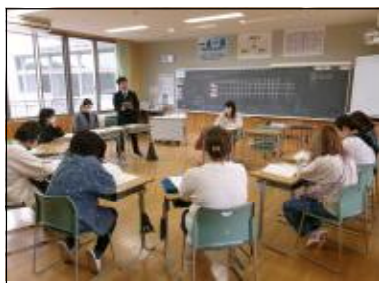
2 年学年懇談の様子