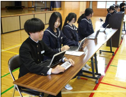
執行部長の皆さん

生徒総会では、各執行部からの提案に対して、たくさんの意見や要望、質問が出されました。各執行部長のしっかりとした答弁が、頼もしかったです。総務部からは、昨年度の学校評価アンケートで保護者から要望のあったくつ下の色についての提案があり、「くつ下は、白以外（黒や紺）でもよい」ことが承認されました。この後、「生徒心得」にも反映させていきます。また、「希望坂」のように、食堂横の道路にも名前を付けたいとの提案があり、名前を募集していくことになりました。各執行部等の活動計画や提案が承認され、前期の活動が本格的にスタートしました。今年度も、生徒会活動を活性化するアイデアなど、生徒一人一人の主体的な取組を期待しています。