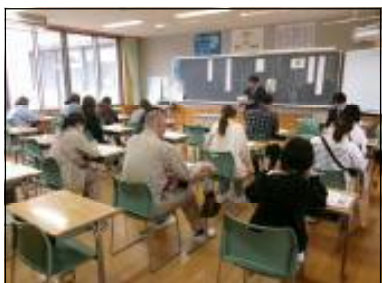
1 年学年懇談の様子