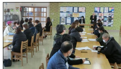
給食説明会の様子

学年懇談後には、PTA役員会が開かれ、今年度の事業を振り返りと次年度に向けての見通しを立てました。今年度も、役員の方々には大変お世話になりました。ありがとうございました。残り少なくなりましたが、最後までよろしくお願いします。