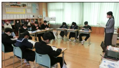
1年生の道徳の授業