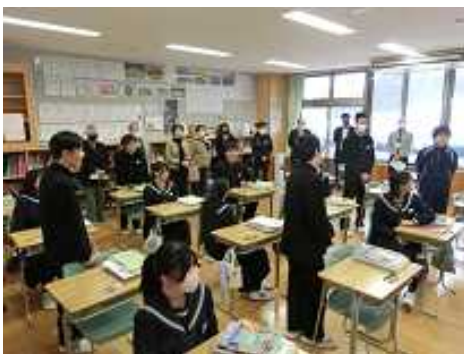
1年社会 北アメリカ大陸の国名を確認

1年生は社会の地理、2年生は技術の加工作業、3年生は国語の手紙を書く準備の授業でしたが、いずれの学年も、活発な意見や反応、取組ぶりが見られ、委員の方からは、そのような雰囲気や環境をうらやましく感じたとの感想もありました。