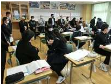
3年国語 5年後の自分に宛てた手紙

さて、駅伝大会や意見交流会をはじめ、様々な面から、その機能を担っていただいている学校運営協議会委員の皆さんです。はじめに、6校時の授業を一巡して、生徒の様子を参観していただき