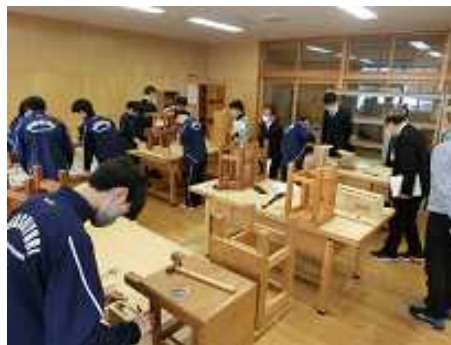
2年技術 本棚など木工作品作り