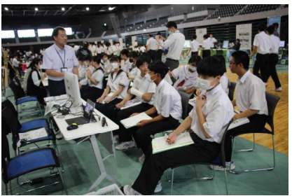
約40の企業ブースが設置