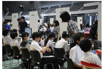
他校の2年生と一緒に参加