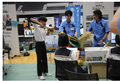
実際に体験する企業も