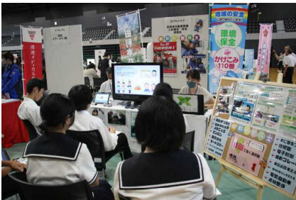
熱心に説明に聞き入る

2年生は、夏休み中に「えみの森保育園」「湯楽里」「金子農産」「ぷれっそ」の4箇所で開催をさせていただくことになっています。今回のPR事業参加と合わせて、自身の職業観の醸成や今後の進路選択に、積極的に生かしてほしいと思います。