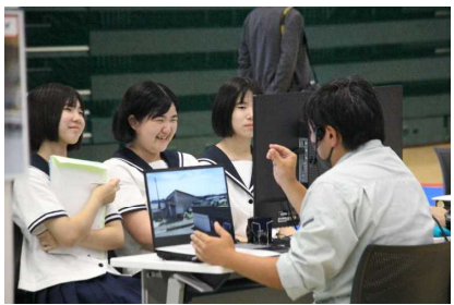
様々な職種や仕事内容を学ぶ