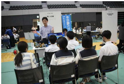
東由利で馴染みの企業も