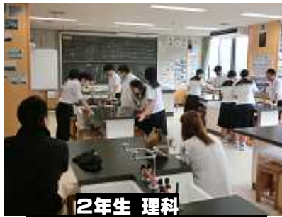
2年生 理科 植物のからだのつくりの実験