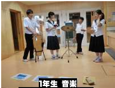
1年生 音楽 イメージを楽器で表現

間もなく夏休みを迎えますが、夏休みの前半には三者面談を予定しております。今回は学級懇談も行いませんでしたが、面談の中で、学習や生活、進路等についての情報交換をさせていただきますので、どうぞよろしくお願いいたします。