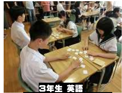
3年生 英語 「させて」などを英語で