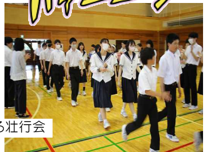
応援のアイデアを出し合うなどみんなで創る壮行会