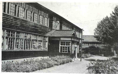
玉米中学校の校舎