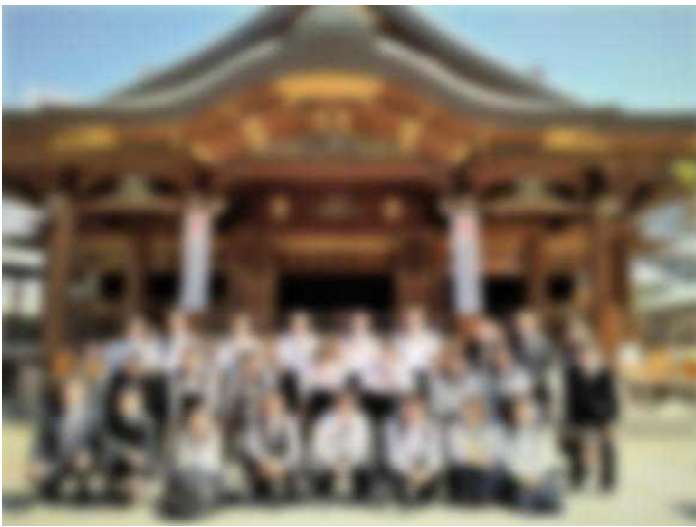
湯島天神にて集合写真

5月14日(日)～16日(火)の3日間、3年生が元気に修学旅行に行ってきました。東京方面への修学旅行は3年ぶりでしたが、無事に楽しんで来ることができて本当によかったと思います。