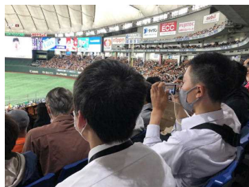
東京ドームで野球観戦