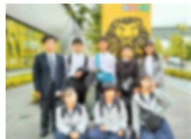
ライオンキングの観劇