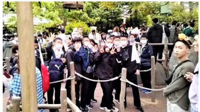
東京ディズニーランドにて