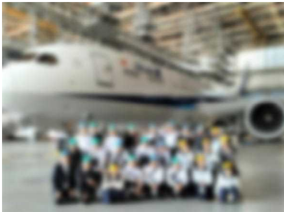
全日空機体工場にて

見学地は、湯島天神や、東京スカイツリーのほか、都内自主研修でそれぞれのグループが計画した皇居や渋谷、浅草、上野、原宿などを巡りました。野球観戦やライオンキングの観劇、ディズニーランドもたっぷり楽しめて、充実の修学旅行となりました。心配された雨にもほとんど降られなかったようで、何よりでした。日頃の精進のたまものですね。