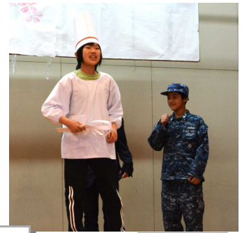
六年生による劇「二十歳を祝う会」。楽しそうに堂々と演じる姿は、さすがでした。