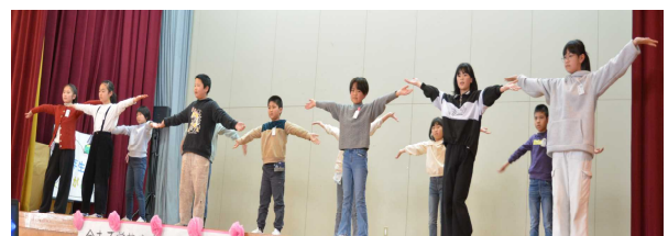
4年生。「6年生にここに大作戦」美しい歌声 と息のそろったダンスで魅了しました。