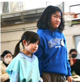
1年生と手をつないで 入場