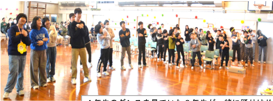
4年生のダンスを見ていた6年生と一緒に踊りはじめ、全校児童も立ち上がり、みんなで踊りました。