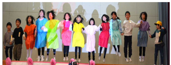
1年生。「かわいいだけじゃないですよ」とい うタイトルでしたが、かわいさ爆発でした。