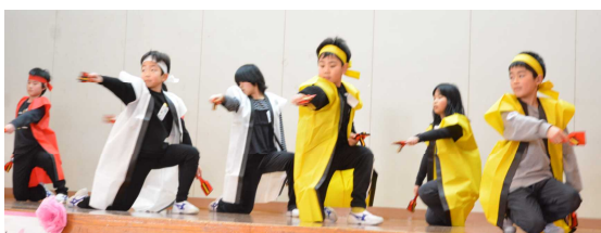
3年生。「いやさか6年生」感謝を込めたはつ らつとした踊り。圧巻のパフォーマンスでした。