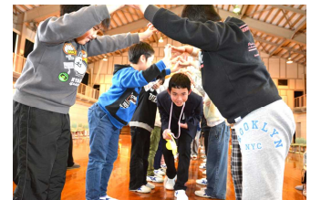
アーチの中を笑顔で退場