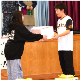
6年生から雑巾のプレゼント