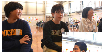
5年生による「思い出のアルバム」の スライドショーを見ながら、この笑顔！