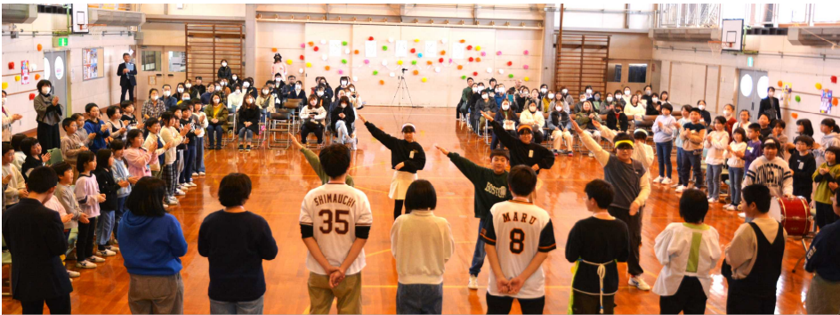
在校生全員からのエール。6年生の背中から、感動が伝わります。