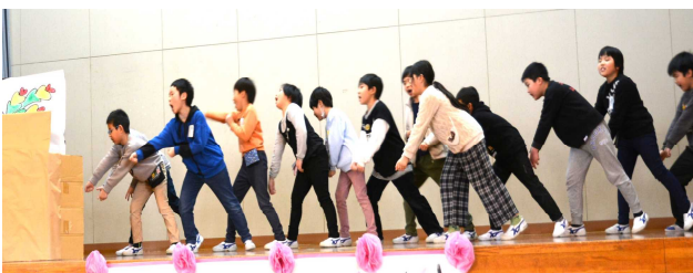
2年生。「大きなかぶ」の劇で、6年生への 感謝を元気いっぱい伝えました。