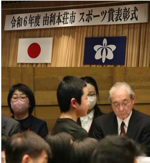
【堂々とした大きな返事、立派でした】

2月10日（月）に、スポーツ分野で今年度活躍なされた本市出身のアスリートや指導者の皆さんを讃える表彰式が、アクアパルで行われました。