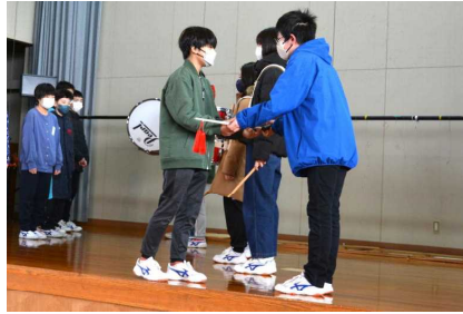
【指揮杖の引き継ぎ】