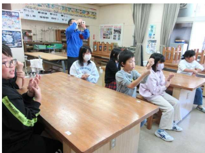
【手首までしっかり】

これから、インフルエンザ等の感染症が本格的に流行する季節に入ります。感染を防ぐ手軽で有効な手段である「手洗い」を皆で実践して、流行を未然に防いでいきたいと思えます。