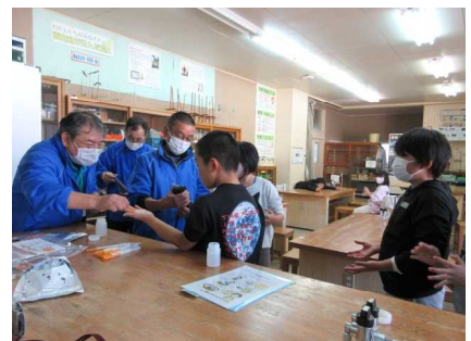
【菌の数は減ったかな？】