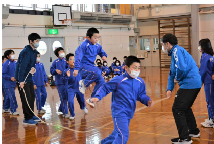
【事前に立てた目標を達成した3年生と4年生】