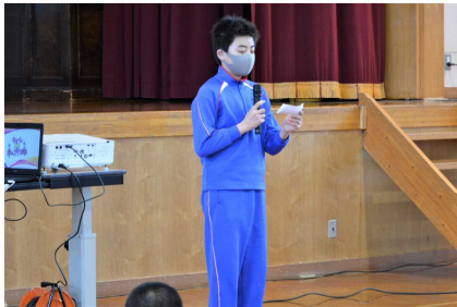
【体育委員長あいさつ】

トップは赤組の142点でしたが、白組も黄組も100点を大きく超え、とてもいい勝負になりました。