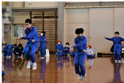
【後ろあや跳び・後ろ交差跳び】