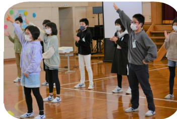
(5年生からのエール)