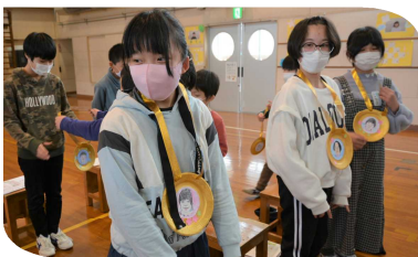
(2年生からメダルのプレゼント)