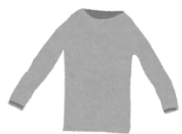
インナーシャツ (長袖だと◎)