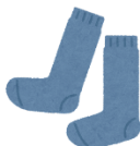
長い靴下 (足首が隠れる丈◎)