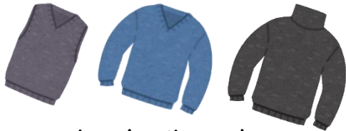
セーターやニット (首元が隠れるハイネックもOK)