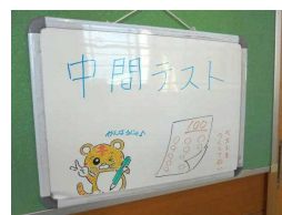
図書室前には応援メッセージも