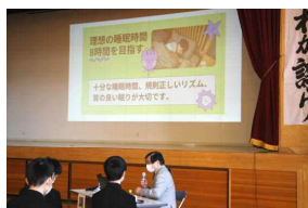
教育講演会:健康な生活習慣について

その後、講演会の内容を受け、鳥海地域学校運営協議会の方々や小学校6年生の皆さんを交えての「熟議」では、『健康な余暇の過ごし方』について7グループに分かれてアイディアを出し合いました。生徒たちにとっては自分たちの生活を見直し、充実させるための貴重な機会になったようです。今後の学校や家庭での様子が楽しみです。