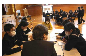
熟議:話し合い(左)・全体で共有(右)