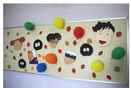
鳥海「ウルトラ」大作戦 ～ 潤いのある環境 & トライする精神 ～