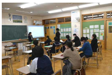
1年生[自分・地域を知る]

生徒たちの有意義な冬休みにつながるよう、家族からの声掛け等よろしくをお願いします。