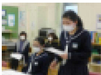
2年生[自分について考える]