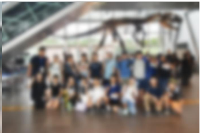
2日目最初の「仙台市科学館」見学中は強雨