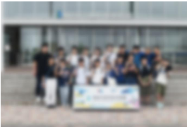
1日目の最後は「仙台うみの杜水族館」を満喫