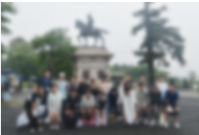
2日目「青葉城址」でもまだ小雨。しかし・・・ → 最後のベニーランドでは雨具の必要なし！