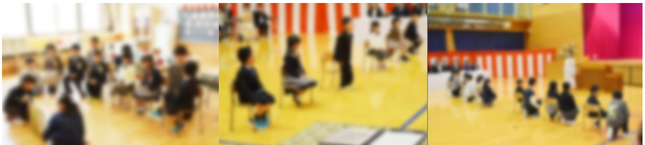
【式の前に、絵本の読み聞かせ中】