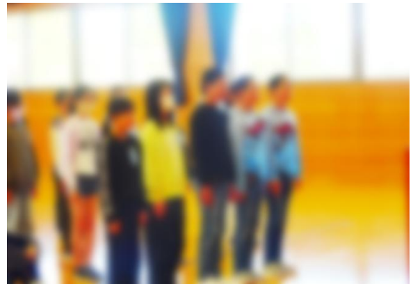
【頼もしい委員長さんたちです】