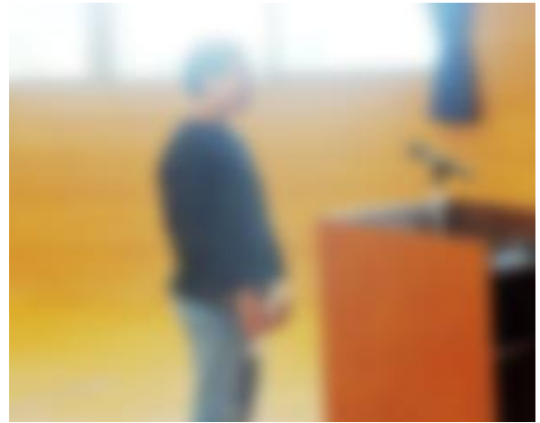
【**さんの決意表明、大変立派でした】

3年学級委員長 ***** さん 4年学級委員長 ***** さん 5年学級委員長 ***** さん 6年学級委員長 ***** さん