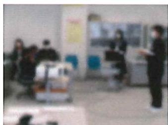
【先輩方も先生方も優しく、中1ギャップの心配などありません！】

1ヵ月後に卒業式を迎える6年生が、中学校生活について生徒会の先輩方から説明を聞いたり、中学校の小*先生と数学の授業を行ったりしました。中学校の教室に入り、いざ授業となったときの緊張と期待の度合は一人一人違ったようですが、「コンパスと定規だけでいろいろな角度をつくる」という課題に、頭をフル回転させながら楽しく取り組むことができました。