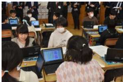
授業公開の5年生の様子