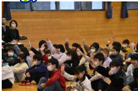
問い掛けに挙手する子どもたち

残りの登校日数も限られてきます。6年生が運動会テーマに掲げてくれた「限界突破」に「本気」で挑戦することを呼びかけました。今年度は「よりよいあいさつ」「よりよいおそうじ」をがんばりの柱にしています。今年度の最後の最後までレベルアップを子どもたちと一緒に目指していきます。