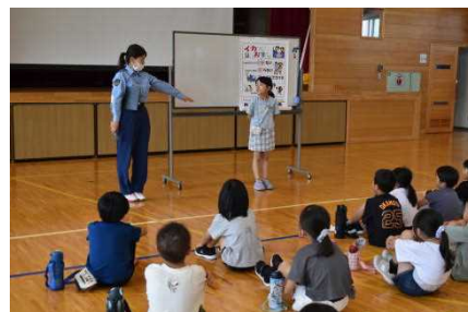
(不審者とは伸ばした手が触れない距離を)

7月19日(金)、防犯教室で由利本荘警察署から生活安全課主任専門官、スクールサポーター、交通安全ボランティア(由利本荘市少年保護育成委員会)をお迎えして下学年は不審者から身を守るための学習を、上学年はSNSから安全を守るための学習をしました。不審者対策では「1挨拶をしっかりとすること、2ルールを守って生活すること、3困ったことは大人に相談すること」、SNS対策では「1ルールをしっかりと守ること、2困ったことは顔が分かる大人に相談すること」とアドバイスをいただきました。「SNS使用